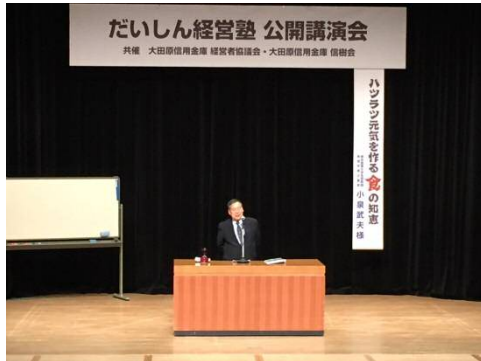
「だいしん経営塾」講演会