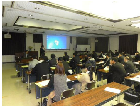
「信樹会」合同研修会・講演会