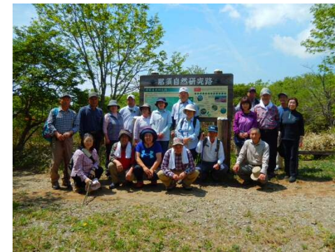
「だいしん会」ハイキング(東那須野支店)