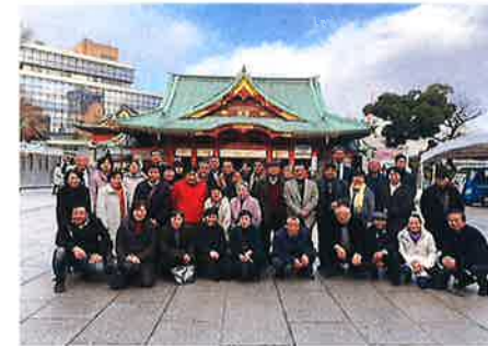
那須塩原支店だいしん会旅行