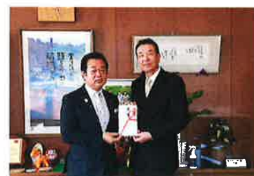
だいしん文庫贈呈