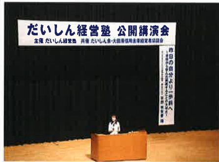
「だいしん経営塾」講演会