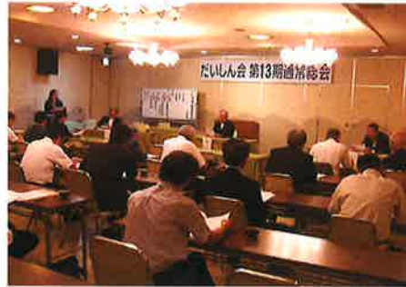
西那須野支店だいしん会総会