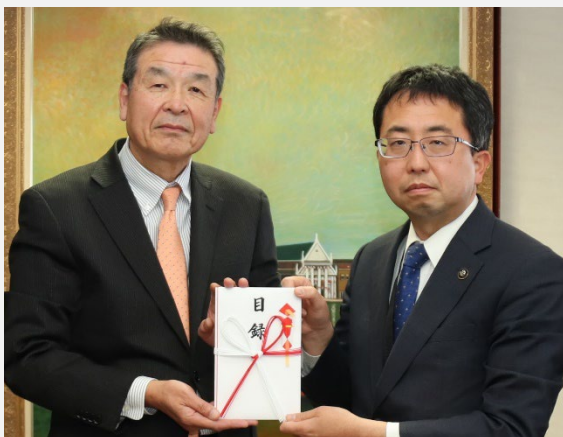
【だいしん文庫贈呈】